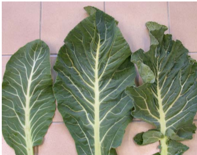
1 отсутствует или очень слабая